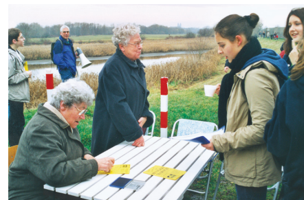
Unbestechliche Kontrolle in Prester: Erster Stempel für zwei Schülerinnen

Jeder Teilnehmer hatte Sponsoren geworben, die für jeden seiner gelaufenen Kilometer versprochen, einen bestimmten DM-Betrag zu spenden. Nach dem Marsch werden diese Beträge von den