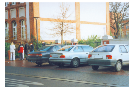
Eine Unsitte und verkehrswidrig ist das Parken unmittelbar vor der Schule. Hier werden nicht nur die Kinder behindert und z.T. gefährdet, sondern auch der notwendige Weg für die Feuerwehr, Krankenwagen u.a.m. verstellt. Meist handelt es sich um Eltern, die ihre Kinder abholen oder bringen. Künftig ist das zu unterlassen!

Im Unterschied zu den letzten Schulgottesdiensten ist die Regelung so, dass an den beiden ersten Terminen die erste Unterrichtsstunde für den Gottesdienst ausfällt, der Stundenplan also nicht nach hinten verschoben wird.