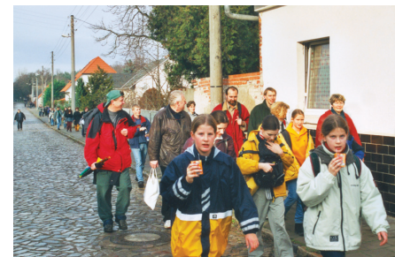
Mit strammem Schritt und Trinkpack in der Hand zum Ziel: In Gommern