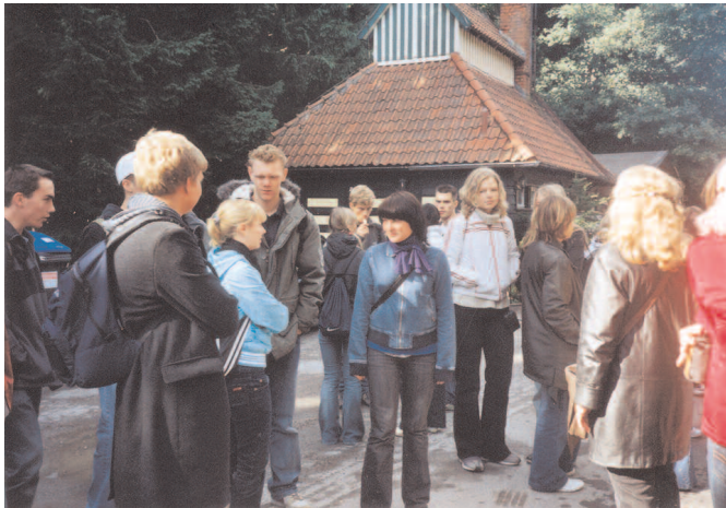
Kurze Rast während des Wanderns. Das Wetter hatte teilweise nicht mitgespielt und beschehrte Nebel und Regen.

rinnen aus drei verschiedenen Nationen trafen sich im Bowlingcenter und schoben mehrere hundert Kugeln. Dienstags arbeiteten wir in Gruppen zum Thema „Meine Stadt - Licht und Schatten“. Dabei erstellte jede Nation eine Wandzeitung, auf der sie die schönen und schlechten Seiten ihrer Stadt mit zahlreichen Bildern und Eindrücken kommentierte. Nachmittags hatten alle noch ein