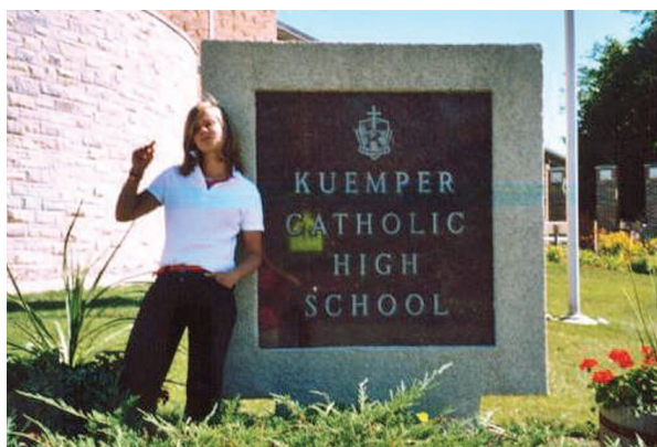
Tolles Gefühl: Einen Stapel Dollars in der Hand zu halten - Football ist hier die Sportart Nr. 1 - Unsere Schule im irren Funktionaldesign - Freunde in Germany, lasst euch von hier aus herzlich grüßen! (Bilder von oben nach unten)

haltet. Doch nicht nur Sport machen, sondern auch gucken ist hier sehr groß, wo wir bei den berühmten Footballspielen wären. Bei allen Heimspielen war fast jedesmal die ganze Schule dabei, natürlich alle in rot/gold - die Schulfarben der „Kuemper Catholic High-School“, auf der ich ein Senior bin.