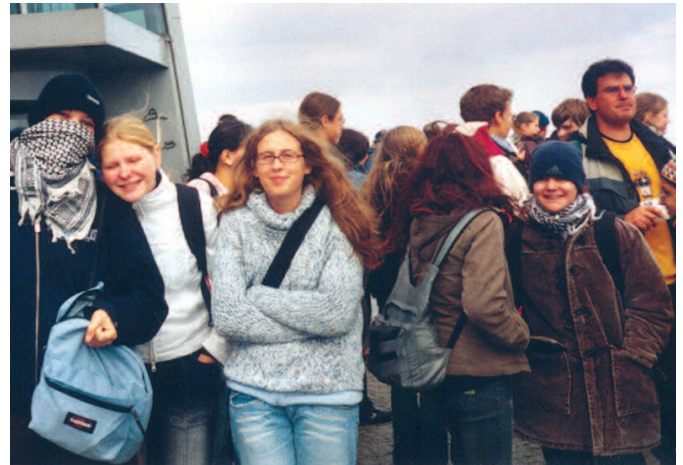
„Gipfeltreffen“ nannten wir dieses Bild. Endlich hatten wir gemeinsam die Spitze des Brockens erreicht.

weiß doch nicht, was die isst,“ und „Was mache ich, wenn . . . ?“... Wie alle feststellen konnten, lösten sich die meisten dieser „Probleme“ aber von selbst.