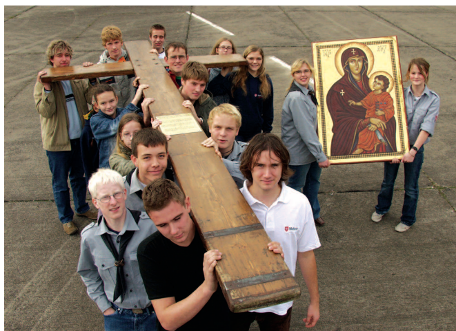
Auf den Weg gebracht ist das Kreuz, das die Kinder und Jugendlichen tragen, als Botschaft des Papstes im Sinne von Versöhnung und Nächstenliebe.

mosphäre und möchten alle die Erfahrungen des gemeinsamen Glaubens über die Grenzen der Kulturen hinweg machen. Der WJT ist eine