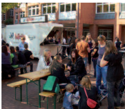
Ein voller Erfolg war das 1. Ehemaligentreffen 2009

Es nicht immer einfach, einen stetigen Kontakt zu allen ehemaligen Mitschülern zu pflegen. Daher ist es gut zu wissen, dass von nun an einmal im Jahr am Tag des Ehemaligentreffens im Norbertusgymnasium eine Möglichkeit geboten wird, in den Dialog mit unseren ehemaligen Mitschülern zutreten. So folgten am 26.09.2009 viele von uns der Einla-