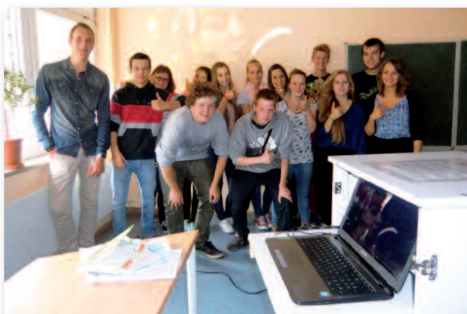
Interessiert wird der Medienwagen begutachtet.