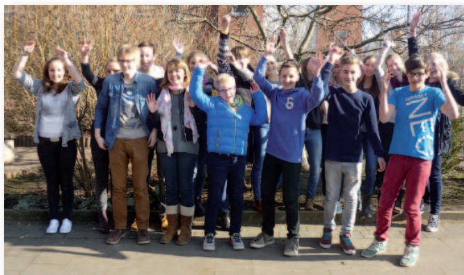
Bild oben: Die Französischgruppe der 8b/d gewann den ersten Preis auf Landesebene beim Internet-Wettbewerb zur Feier des Jahrestages der Unterzeichnung des Elysée-Vertrages unter dem Motto „Franzosen und Deutsche: Einmal Freunde, immer Freunde“ in der Kategorie „Anfänger“.