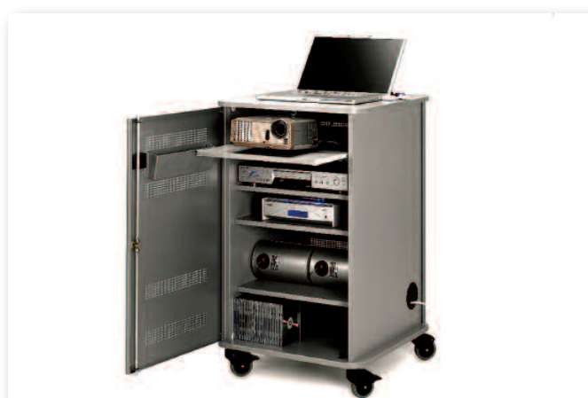
So könnte ein Medienwagen ausgestattet sein.